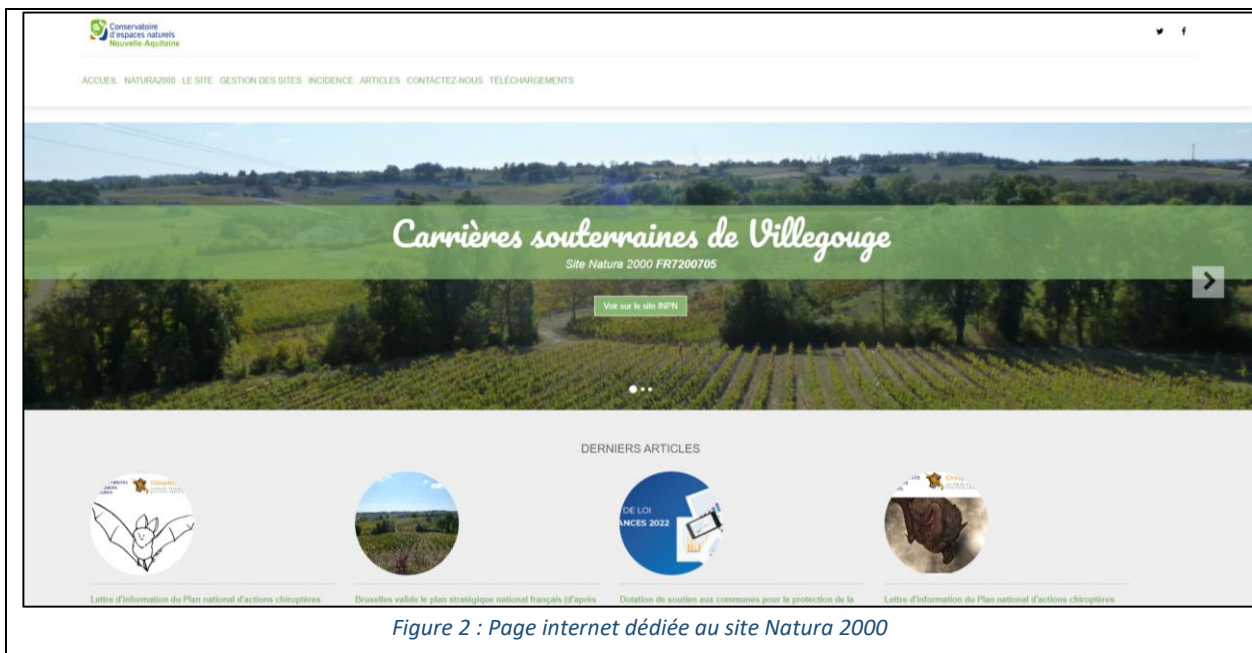
Figure 2 : Page internet dédiée au site Natura 2000

Il est important de noter que ce site est transférable en cas de changement d'animateur. Le site est opérationnel depuis début 2021 et peut être visité à l'adresse suivante : https://carrieres-souterraines-de-villegouge.fr/